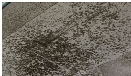
天井の結露が原因でカビが発生…