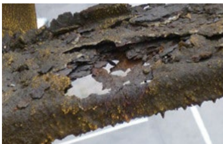
外階段が老朽化でボロボロ…