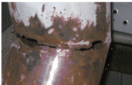
配管に穴が空いている…