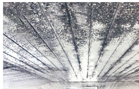
天井が結露でカビだらけ…