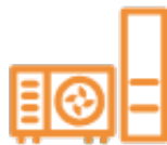
産業ヒートポンプ