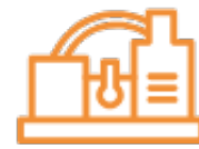
コージェネレーション