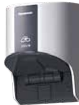
普通充電器(コンセント型)