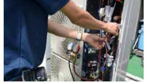
フロン点検(簡易・定期)