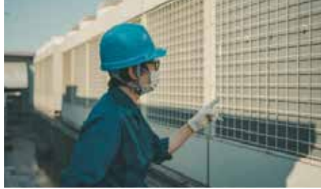
省エネ補助金活用