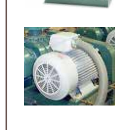
ポンプ・ファン・ブロウ