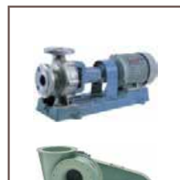
ポンプ・ファン・ブロウ