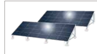
再エネルギー設備の導入