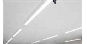
省エネルギー対策の推進