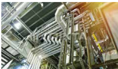
プラント配管・特殊配管