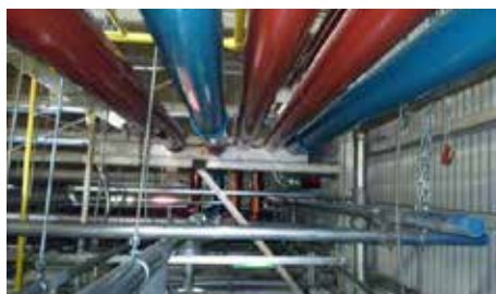
給水配管・蒸気配管