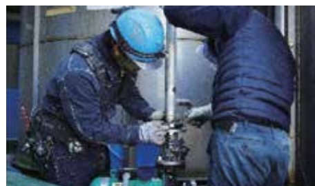
エア配管・ダクト